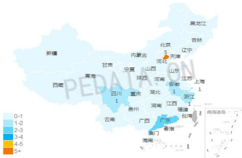
图4 IPO企业地域分布情况