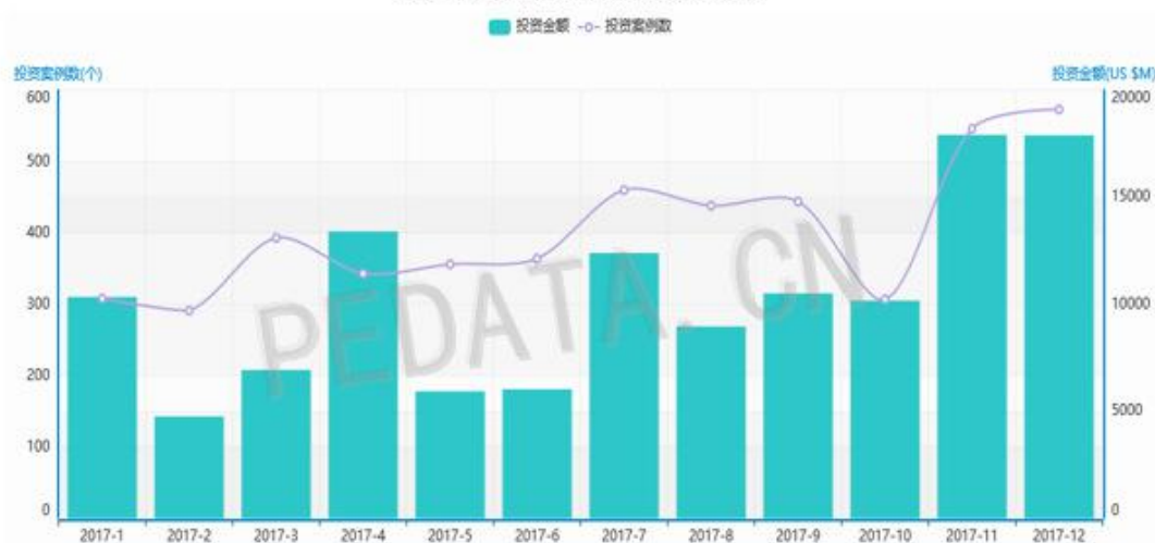
图 1 总投资数里和金额月度走势

根据清科旗下私募通数据显示，2017 年 12 月共发生投资案例 554 起，其中披露金额的案例 443 起，案例数环比增长 4.1%；从投资金额角度看，12 月份总投资金额为 167.78 亿美元，平均投资金额 3787.36 万美元。12 月份投资在案例数和金额方面的环比都有小幅度增加，2017 年 VC/PE 市场火热收尾。