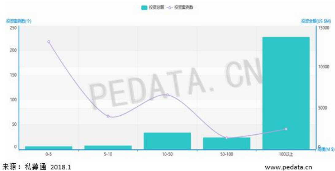
图3 中国 VC/PE 市场投资规模分布