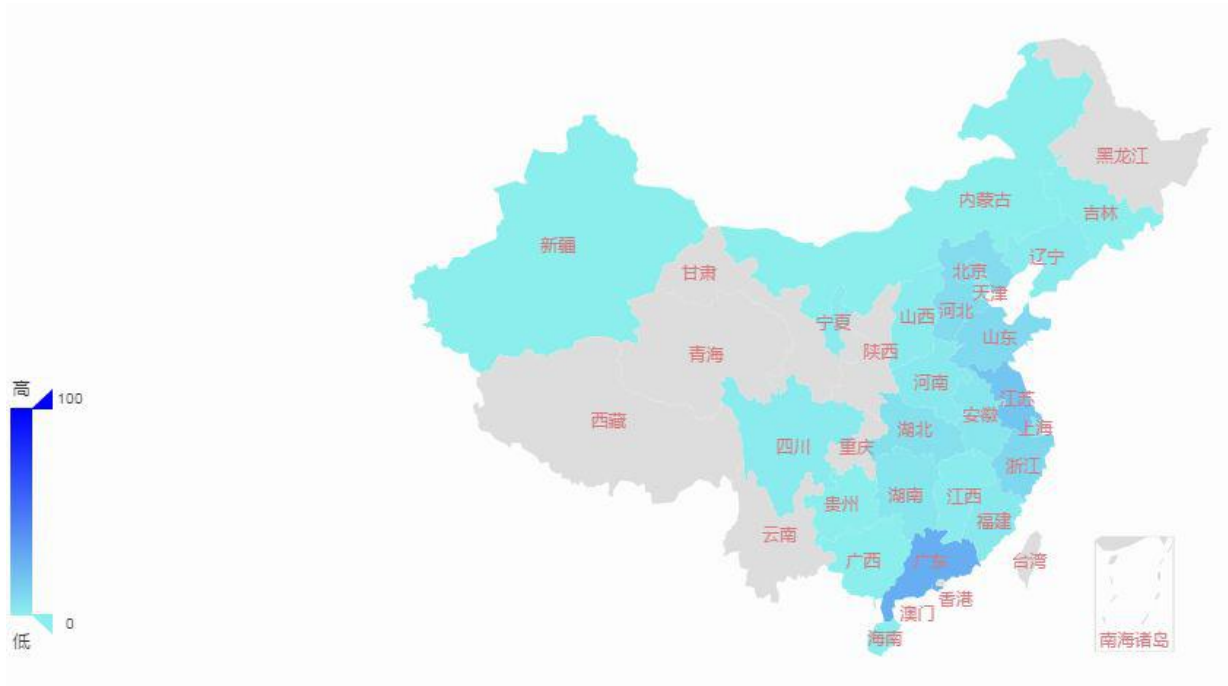
图 5 11 月挂牌企业地域分布情况

支持的企业共 18 家，IT、互联网、生物技术/医疗健康分列前三位，分别挂牌 7 家、3 家和 2 家，占比依次为 38.9%、16.7%和 11.1%。