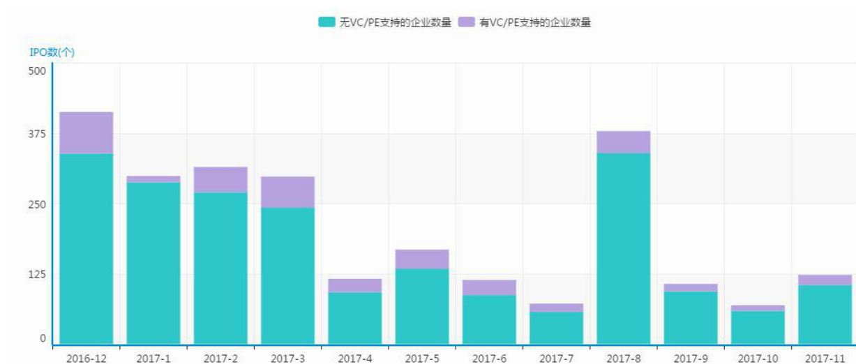
图 1 新三板挂牌企业月度走势

根据清科旗下私募通统计，截至 2017 年 11 月新三板挂牌企业数量达到 11645 家，基础层企业 10283 家，创新层企业 1362 家。从转让方式来看，采用协议转让方式 10279 家，采用做市转让方式 1366 家。本月新增挂牌企业共 123 家，环比增长 78.3%，在所有挂牌企业中，有 VC/PE 支持的共有 18 家，占比 14.6%，环比上升了 80.0%。