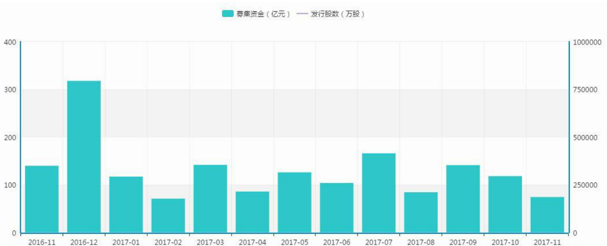
图 3 新三板定向增发情况

根据股权转让说明书中的信息披露，2015 年 12 月 28 日，上海益菁汇资产管理有限公司、上海秉圆资产管理有限公司、苏州博润玲珑股权投资中心（有限合伙）、武汉光谷博润新三板投资中心（有限合伙）、深圳福星资本管理有限公司以每股 3.00 元的认购价格对润和催化进行投资，投资总金额为 5400.00 万人民币，共获得股权占比 15.0%。2016 年 3 月 1 日，菁华新三板 1 号基金、菁华新三板 5 号基金、菁华新三板 520、秉创富 2 号联合参与了新一轮融资，投资总金额为 3600.00 万人民币，共获得 10.0% 的股权。